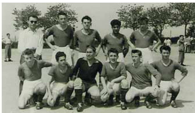
Squadra Nazionale di Calcio del Collegio di Torino anni 1951 - 1952"