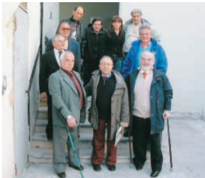
“Alcuni degli Ex Allievi presenti all’inaugurazione...”